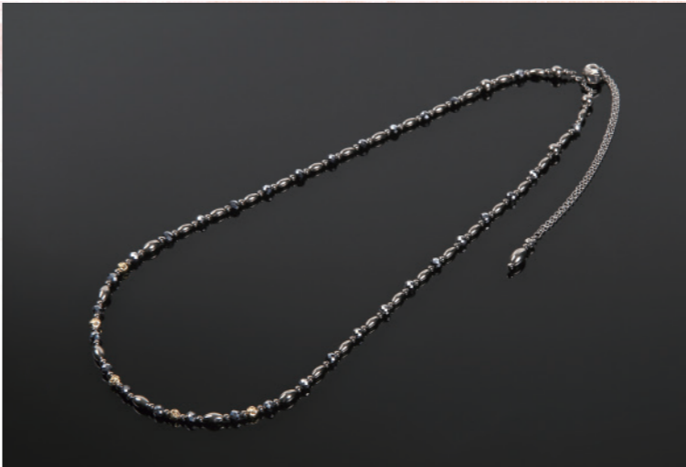
Phoenix GM/1310-70 K18G 70cm ¥280,000+税 管理医療機器認証番号302AGBZX00022000