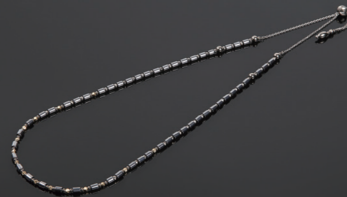
Phoenix GM/1313-70 K18G 70cm ¥280,000+税 管理医療機器認証番号:302AGBZX00022000