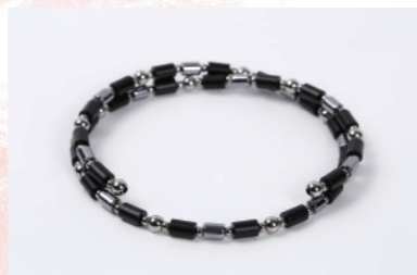
TBL-B-38 38cm ¥88,000+税