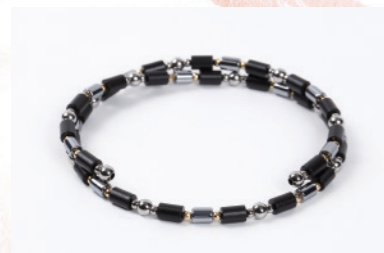
TBL-B-38 K18G 38cm ¥128,000+税