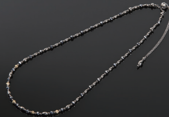
Phoenix GM/1310-70 K18G 70cm ¥280,000+税 管理医療機器認証番号302AGBZX00022000