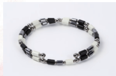
TBL-B&W-38 38cm ¥88,000+税