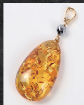
GM1299(L) 18K ¥100,000+税