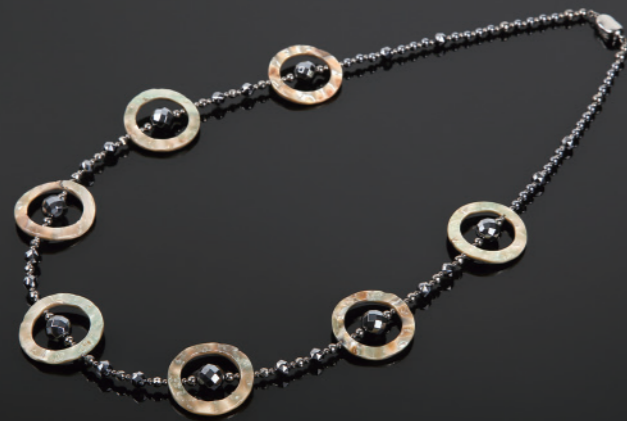
Venus GM/1319-70 70cm ¥180,000+税 管理医療機器認証番号302AGBZX00022000