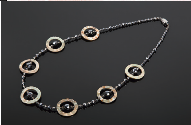
Venus GM/1319-70 70cm ¥180,000+税 管理医療機器認証番号302AGBZX00022000