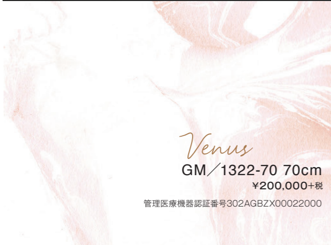
Venus GM/1322-70 70cm ¥200,000+税 管理医療機器認証番号302AGBZX00022000