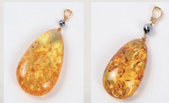
GM1299(M) 18K ¥50,000+税