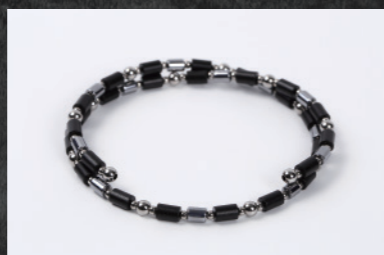
TBL-B-38 38cm ¥88,000+税