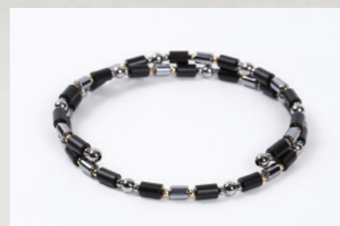
TBL-B-38 K18G 38cm ¥128,000+税