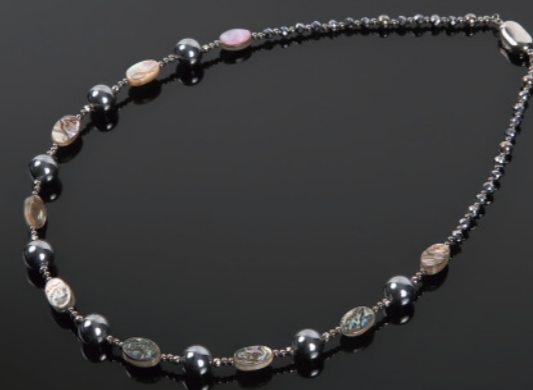
Venus GM/1317-50 50cm ¥150,000+税 管理医療機器認証番号302AGBZX00022000