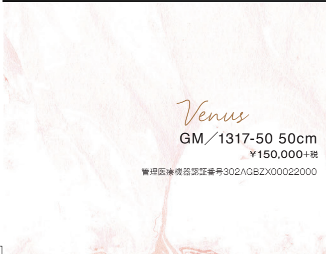
Venus GM/1317-50 50cm ¥150,000+税 管理医療機器認証番号302AGBZX00022000