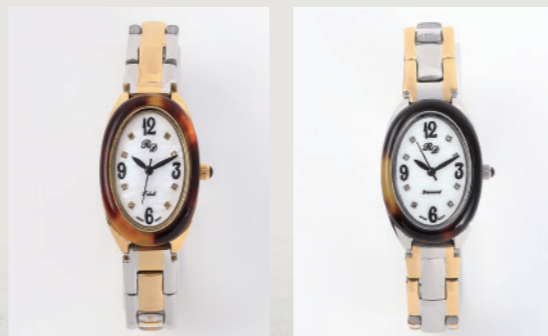
TW-G ¥200,000+税 TW-S ¥200,000+税

本体ステンレス316L/ベルトステンレス304/シールドIPメッキ/ 防水水深30M/サファイアガラス/Miyota製ムーブメント