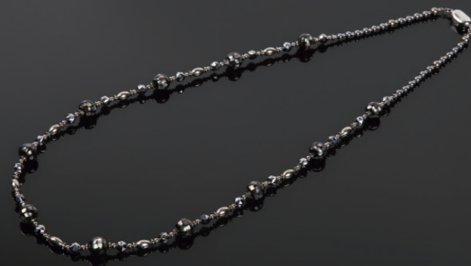
Venus GM/1320-70 70cm ¥200,000+税 管理医療機器認証番号302AGBZX00022000