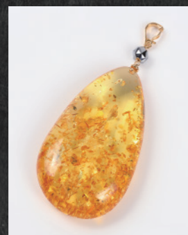
GM1299(M) 18K ¥50,000+税