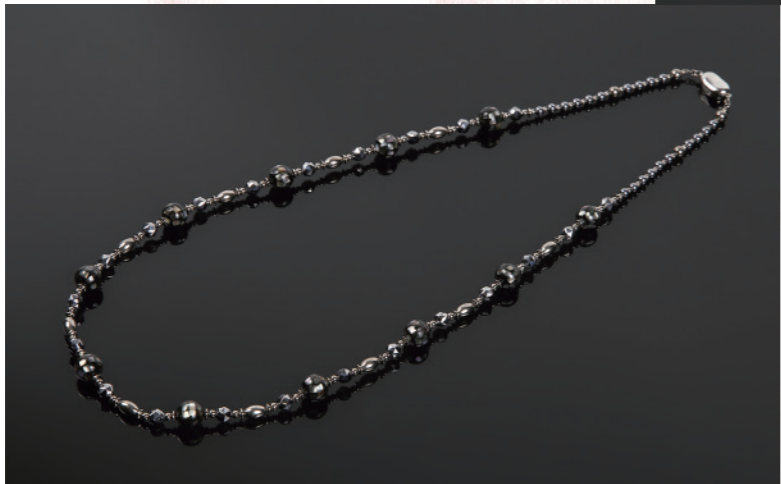
Venus GM/1320-70 70cm ¥200,000+税 管理医療機器認証番号302AGBZX00022000