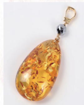
GM1299(L) 18K ¥100,000+税